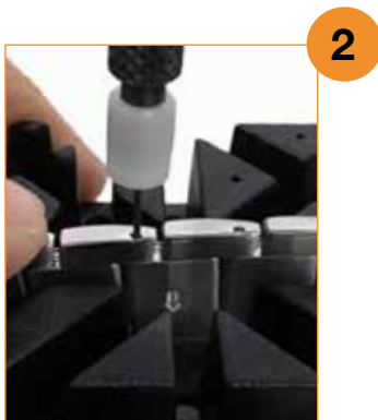
Extraer pasador Remove the pin